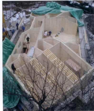
Vormvaste prefab panelen worden op de bouwplaats in korte tijd in elkaar gezet

Omdat het hout niet wordt bewerkt, is het na afloop van de levensduur zowel biologisch als technisch recyclebaar. Zo heeft bijvoorbeeld het Oostenrijkse Holz100 een gouden cradle to cradle certificering. Naast Holz100 is sinds kort ook Nur-Holz in Nederland verkrijgbaar, beide systemen worden geïmporteerd door